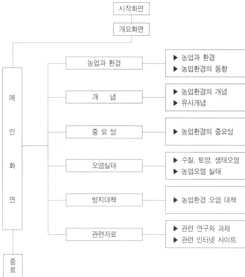
그림 1. CD-ROM 타이틀의 화면구성