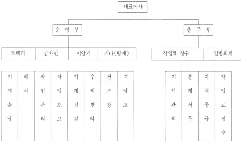
(그림 2) 남광委託營農合名會社의 組織

나. 委託營農會社 從事者의 職務內容 위탁영농회사 종사자의 직무는 회사에 조직되어 있는