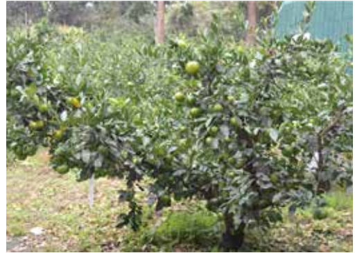
[그림 23] 9월 줄기 진행방향과 거의 반대방향으로 자라는 열매