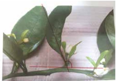
[그림 13] 착화된 액아의 사잇각 확대