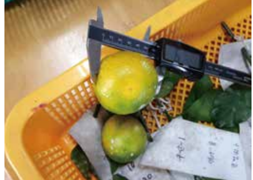
[그림 10] 열매크기 측정