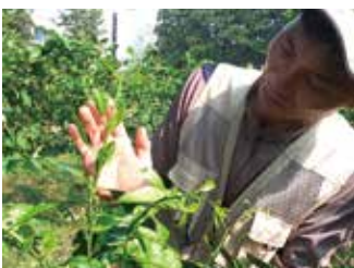
[그림 6] 동자열매 관찰

결과모지의 수평(흰색)/수직(노란색) 2가지 유형에 대하여 '열매 수'를 월별로 모니터링하여 기록하고 필요시 영상촬영을 병행했다.