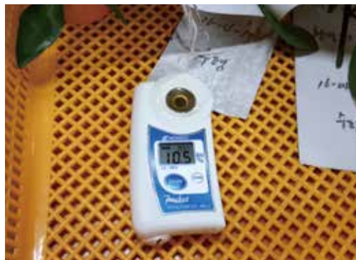
[그림 11] 당도 측정

열매가 완숙되면 태그를 매단 결과모지의 최종 열매로 2차 당도를 측정하여 비교 분석했다.