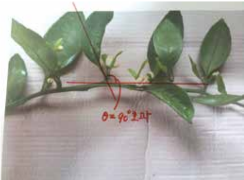
[그림 12] 착화된 액아의 사잇각