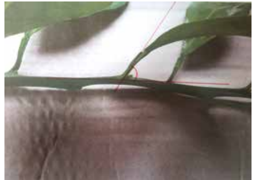
[그림 15] 신초 발아한 액아 사잇각 확대

감귤나무의 개화 위치를 면밀히 관측한 결과, 정상적인 경우에는 결과모지의 액아에서 꽃이 피었다. 다만 결과모지의 액아마다 꽃이 피는 것이 아니라, 액아를 둘러싸고 있는 잎과 줄기 진행방향에 이루는 각도에 따라 달라지는 것으로 추정하였다. 줄기 진행방향과 잎맥이 이루는 각도가 직각이 되면 주로 꽃이 피는 것을 관찰하게 되었다.