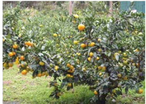
[그림 25] 11월 줄기 진행과 반대인 열매꼭지 방향과 열매의 완숙

결과모지에서 개화부터 완숙되는 과정까지 열매가 상하로 움직이며 이동하는 현상을 관찰하였다. 주지나 측지라는 기저줄기를 기준으로 처음에는 수직으로 성장하다가 어느 정도 성장하면 기저줄기 아래로 이동하여 익어가는 현상이 관측되었다. 이는 열매 무게가 점점 무거워지면서 성장하는 위치가 위에서 아래로 이동하고 있다고 해석된다.