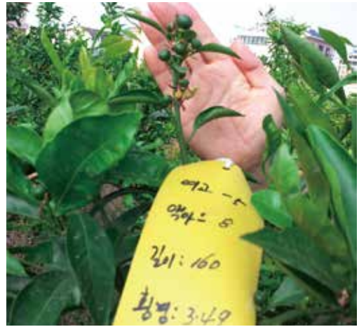
[그림 27] 줄기 진행과 나란하게 성장하는 수직 결과모지의 6월 열매

2) 열매가 모두 수평으로 누우면서 성장이 진행되는 수평·수직 결과모지의 9월 열매