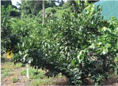
[그림 22] 8월 줄기 진행방향과 각도가 벌어지는 열매 성장