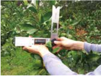
[그림 1] 결과모지 각도체크