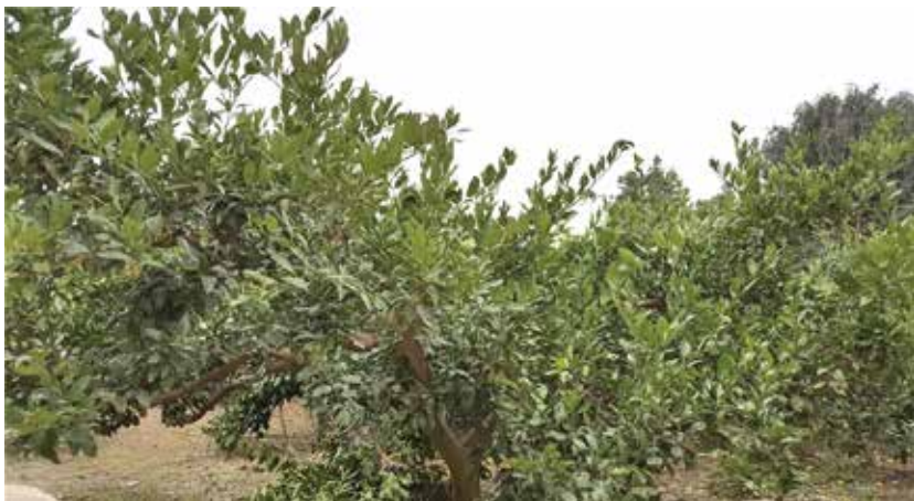
[그림 33] 개선된 방법으로 전정한 일명 ‘아크탄젠트 수형’ 최종 모델

감귤나무 정지전정 시 가지들을 자르거나 남길 때 일반적으로는 ‘수량이나 길이 중심’의 개심자연형 수형법을 주로 쓰는데 [그림 33]은 새로운 ‘각도 중심’의 개선된 방법을 적용하여 정지전정한 모습이다. 이 가지들의 기울기 각도를 중심으로 전정하는 새로운 방법을 일명 ‘아크탄젠트 수형법’이라고 명명하였다.