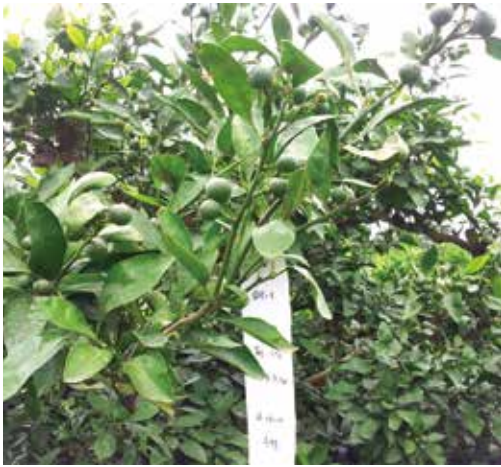
[그림 26] 줄기 진행과 나란하게 성장하는 수평 결과모지의 5월 열매

1) 열매가 모두 위로 향하면서 성장하는 수평·수직 결과모지의 5, 6월 열매