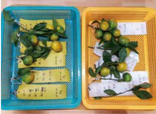
[그림 9] 열매 수 확인

열매 성장이 끝나면 태그를 매단 결과모지의 ①열매 수 ②열매 크기 ③1차 당도를 측정하여 비교 분석했다.