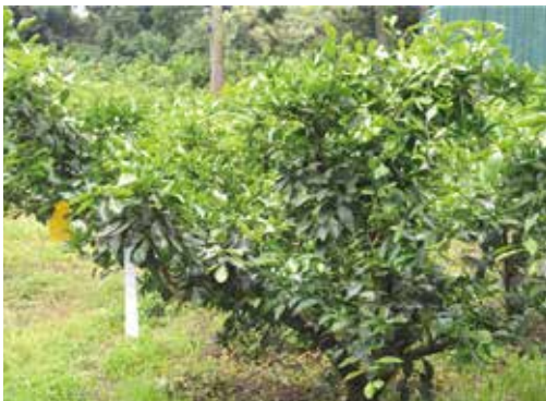
[그림 20] 6월 줄기와 앞에 가려진 동자 열매 성장