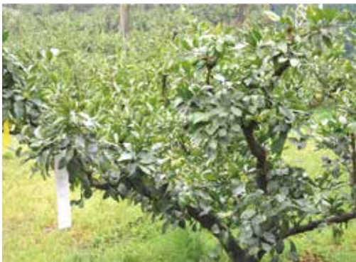
[그림 18] 4월 전정직후 감귤나무

[그림 18]에서 [그림 25]까지는 전정 이후부터 감귤나무에서 꽃 피고, 열매 맺고, 성장하고, 완숙되는 과정을 매주 촬영하고 월 단위로 샘플링한 것이다. 그림 비교의 주요 포인트는 열매의 꼭지가 줄기와 나란한 방향으로 성장하다가 일정 시점이 되면 무거워지면서 줄기 성장 방향과 열매의 꼭지 진행 방향이 반대 방향으로 되는 점이다. 열매는 커갈수록 무거워져 중력 작용을 받아 아래로 내려가고, 반면에 줄기는 항상 수직 방향으로 올라가려 하므로 열매의 크기에 따라 줄기의 진행 방향과 각도가 달라지는 것이 관찰되었다.