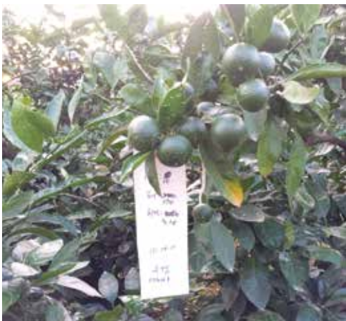
[그림 28] 열매 달린 수평 결과모지가 수평화 되기 시작하는 9월 열매

2) 열매가 모두 수평으로 누우면서 성장이 진행되는 수평·수직 결과모지의 9월 열매