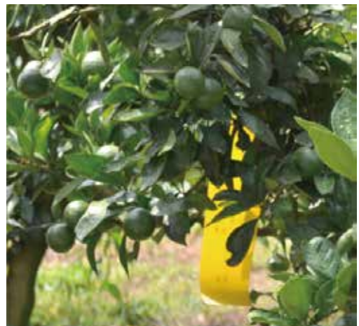
[그림 29] 열매 달린 수직 결과모지가 수평화 되기 시작하는 9월 열매