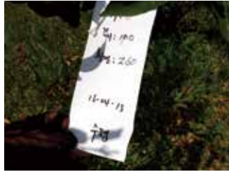
[그림 2] 수평결과모지 태그