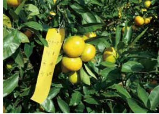
[그림 31] 열매 달린 수직 결과모지가 역 수직화 되어 익어가는 10월 열매

꽃 피고 열매 달리는 결과모지의 지면을 기준으로 수직방향( 90^\circ )으로 향하다가 열매가 커지고 익어갈 때면 역 수직방향( -90^\circ )으로 향하는 것을 관측하였다.