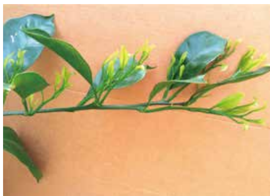
[그림 17] 싹초 발아한 결과모지의 둥근 꼴 줄기 모양