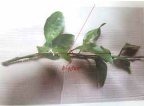
[그림 14] 신초 발아한 액아의 사잇각