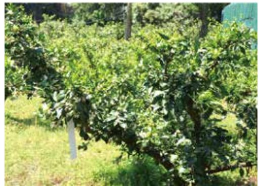
[그림 19] 5월 꽃이 만개한 동시에 신초발아 성장