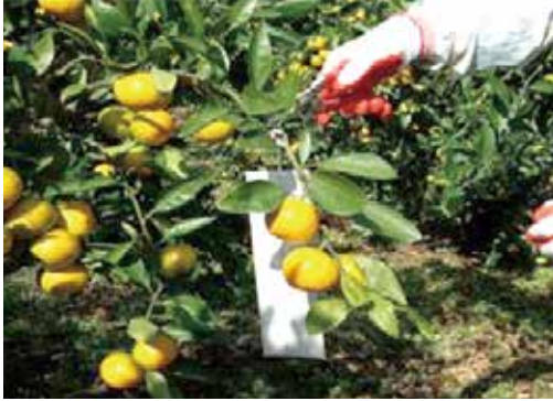
[그림 30] 열매 달린 수평 결과모지가 역 수직화 되어 익어가는 10월 열매