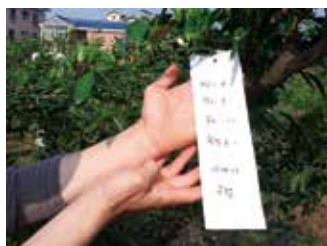
[그림 7] 수평지 열매(흰색)