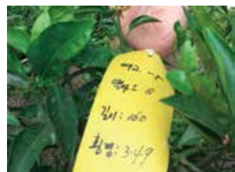
[그림 8] 수직지 열매(노란색)