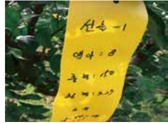
[그림 3] 수직결과모지 태그