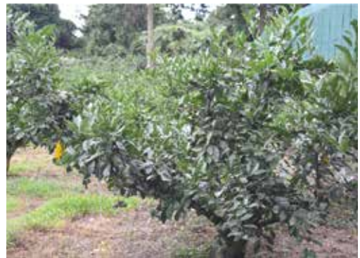
[그림 21] 7월 줄기 진행방향과 나란한 동자 열매 성장