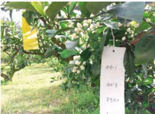
[그림 4] 착화된 결과모지의 액아

①길이 ②직경 ③겨드랑눈 수(액아 수)를 표식하여 결과치 분석 시 반영했다.