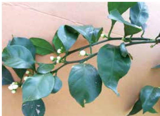
[그림 16] 착화된 결과모지의 삼각형 꼴 줄기 모양